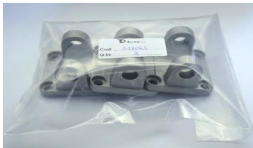
.1 = PEZZO SENZA CONFEZIONAMENTO PIECE WITHOUT PACKAGING