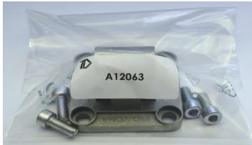
.3 = PEZZO CON CONFEZIONAMENTO SINGOLO E VITI PIECE WITH SINGLE PACKAGING AND SCREWS